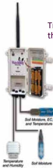
Trạm sương & thủy lợi

Để dàng phát hiện sương và được cảnh báo về các điều kiện trong cây trồng của bạn, theo dõi và lưu ý các điều kiện thực tế của côn trùng và bệnh, theo dõi độ ẩm của đất từ xa.