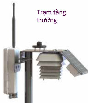
Trạm tăng trưởng