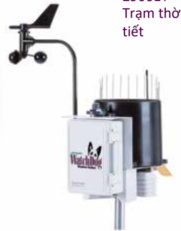
2900ET Trạm thời tiết

Đo DLI (Khoảng thời gian ánh sáng hàng ngày), thời gian và cường độ ánh sáng để có chất lượng thực vật tốt hơn trên các cấu trúc nhà kính và đường hầm cao. Đối với trồng ngoài trời nên theo dõi độ ẩm của đất, nhiệt độ và EC để thực hành tưới hiệu quả.