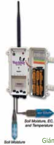
Trạm thủy lợi

Giám sát linh hoạt cả độ ẩm của đất và EC trong nhiều loại kết cấu đất khác nhau để đưa ra quyết định tưới tốt hơn.