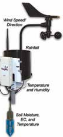
Trạm thời tiết đo độ ẩm đất