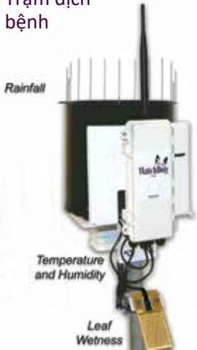
Trạm dịch bệnh

Nắm bắt các điều kiện cụ thể tại địa điểm từ xa đối với áp lực của côn trùng và bệnh tật, đơn vị độ ẩm của đất, điều kiện thời tiết, ánh sáng và nhiều hơn nữa.